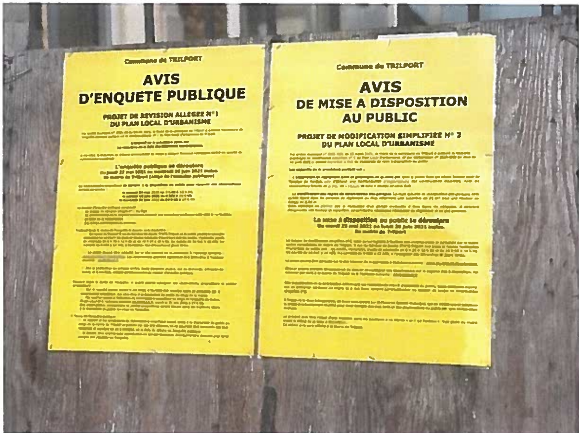
Affichage légal de l'enquête sur le panneau de la Mairie de Trilport

Ainsi, il semble que les mesures de publicité de l'enquête publique, ont, au regard du commissaire-enquêteur, respecté les intentions de la réglementation en vigueur.